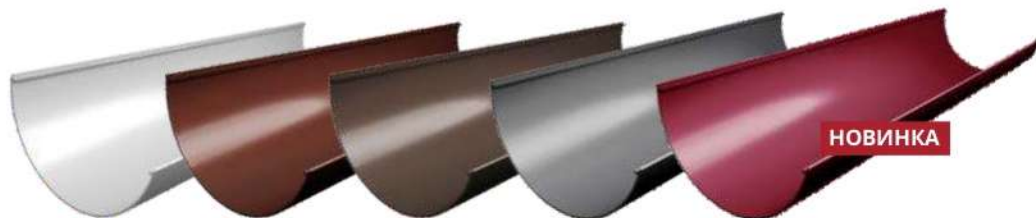
Белый RAL 9003 Шоколадный RAL 8017 Коричневый RR 32 Графит RAL 7024 Бордо RAL 3005