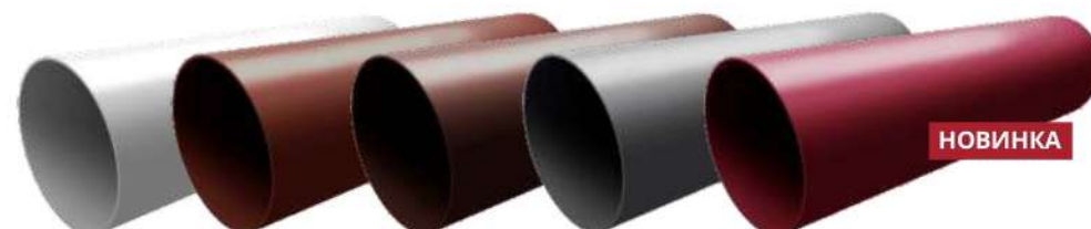
Белый RAL 9003 Шоколадный RAL 8017 Коричневый RR 32 Графит RAL 7024 Бордо RAL 3005